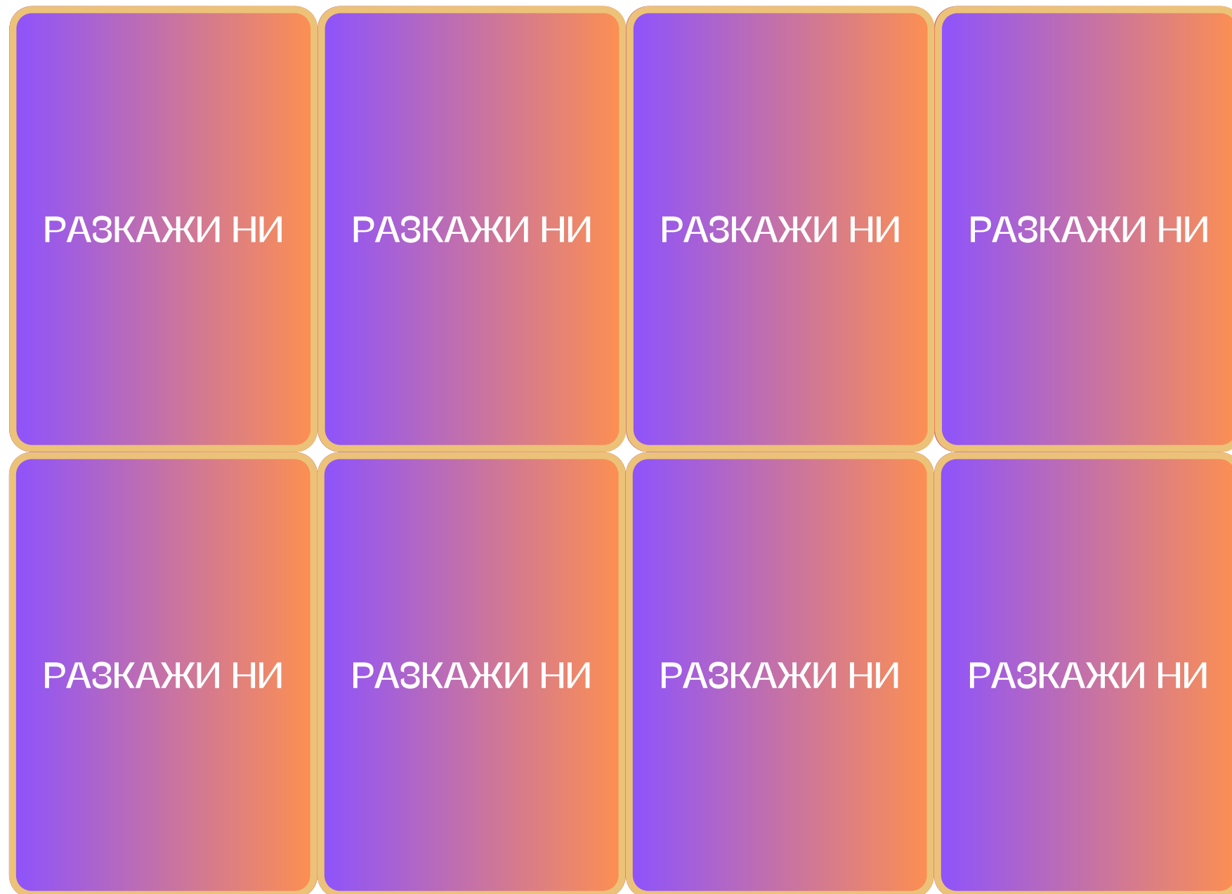
Горната част на третия вид карти, в които разказват за случки и събития, които са преживяли