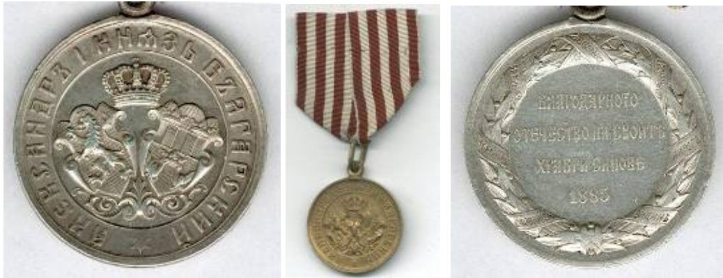
Вторият медал за участие в Сръбско-българската война от 1885 г. (сребърен и бронзов).

Първият вид медал е изключително рядък. Раздаван е в ограничено количество за кратко време, тъй като е спрял от регентите, поради настъпилите събития през август 1886 г. - детронирането на княз Александър I и последвалата негова абдикация.