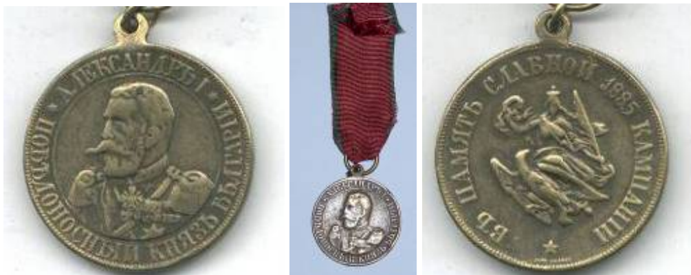
Първият медал за участие в Сръбско-българската война от 1885 г. (сребърен и бронзов, вариант с текст на руски език).

Първият вид медал (първа емисия) е учреден с указ № 29 на княз Александър I Батенберг от 19 февруари 1886 година. Медалът е с две степени: сребърен и бронзов. Със сребърни медали са награждавани всички военни лица, взели пряко участие в Сръбско-българската война от 1885 г., а с бронзови - „всички, които са били на действителна военна служба от 6 септември 1885 г. до 16 декември 1885 г., и които не са взели непосредствено участие в боевете, но са влизали в състава на войсковите части, отряди и управления”. Награждавани са били и граждани, взели участие във войната, а също и служителите във военните болници. 2