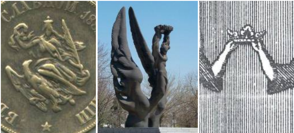
Паметникът на Съединението в Пловдив (в средата), детайл от реверса на първия медал за Сръбско-българската война (вляво) и детайл от герба на Романия (вдясно).

Паметникът на Съединението, издигнат в Пловдив, е една от немалкото недомислици в българската мемориална монументална скулптура от времето на социализма. Представлява внушителна 12-метрова фигура, дело на скулптора Величко Минев. Паметникът е създаден през 1985 г., в чест на 100-годишнината от съединението на Източна Румелия с Княжество България. Според публикувани в интернет коментари, фигурата представя Майката-Родина с лавровия венец на победата в ръце, а крилете в полет, символизиращ двете части на България, разделени в 1878 и обединени в 1885 г.