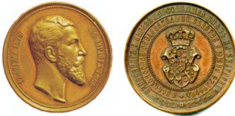
Възпоменателен бронзов медал за управлението на княз Александър I, обединител на Северна и Южна България.

След края на управлението на княз Александър I Батенберг, се появява още един негов герб. Той има пряка връзка със Съединението и Сръбско-българската война от 1885 г. и носи техните символи. Гербът фигурира върху един рядък настолен медал, отсечен в сребро и бронз. Според непотвърдени сведения има и златен. На едната страна на медала е представен бюст на княз Александър Батенберг и датите: 17. АПРИЛЪ 1879 - 26. АВГУСТЪ 1886. На другата страна е изобразен релефен герб, околоръст с двукръгов текст: АЛЕКСАНДРЪ I ПЪРВИЙ ЦАРСТВУЮЩИЙ КНАЗЪ НА БЪЛГАРИТЪ И ПОБЪДНОСНИЙ ОБЕДИНИТЕЛЪ НА СЪВЕРНА И ЮЖНА БЪЛГАРИА.