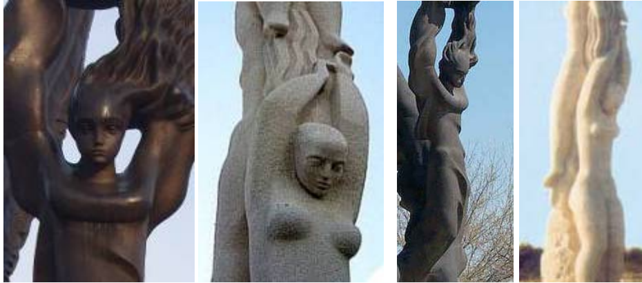
Детайли от паметниците в Пловдив (първа и трета снимка) и Калиакра (втора и четвърта).

С вдигнатите си коси женската фигура от Паметника на Съединението досущ прилича на фигурите от паметника на нос Калиакра, наречен Портата на четиридесетте девойки. Този паметник също е политически. Девойките от Калиакра се хвърлят в морето, за да не попаднат в ръцете на османските поробители. И косите им са вдигнати защото девойките са изобразени в момента на скачането в морето.