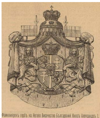
Фамилиарен герб на Негово Височество Българският Князь Александър I.