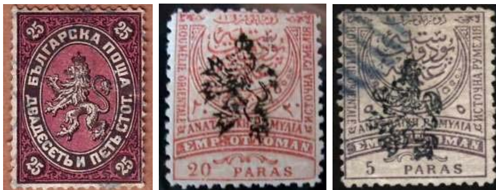
Марка на Княжество България (първата вляво) и марки на Източна Румелия с печат „лъвче“ .