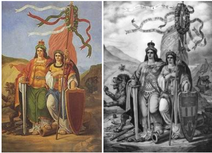
„Съединението на Северна и Южна България в 1885 г.”, картина и литография от Николай Павлович, 1886 г.

Липсата на някои детайли в маслената цветна картина - гербът върху щита, надписите върху лентите, вешци се над знамето и др., подсказват, че тя е недовършена. Изглежда Павлович е започнал да рисува първо нея, а после е създал литографията, вече с много подробности и повече не се е върнал към първия си художествен опит.