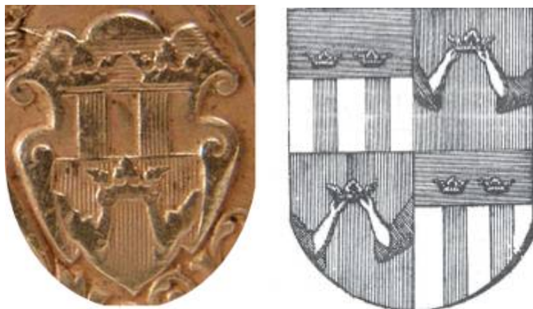
Герб на Южна България от втория медал за участие в Сръбско-българската война (същото е и изображението върху медала за управлението на Батенберг) и герб на Романия от възрожденската „Стематография”.

диагонал с еднакви изображения. Горното дясно и долното ляво хералдично поле е съставено също от две части. В горната част са изобразени две златни корони върху небесносиво поле, а в долната - два червени стълба върху бяло поле. Реципрочните две части на герба представят върху червено поле две ръце - до лакътя със зелени ръкави, държащи златна корона. Както е обяснено в „Стематографията”, ръцете които държат короната, символизират величествения древен Рим и гордата Гърция. С четиристишието под герба пък се подсказва, че двете разделени царства на Рим и Новия Рим ще бъдат свързани от Бог пак в едно. 13