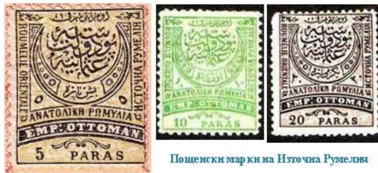
Пощенски марки на Източна Румелия

Въпреки административната автономия, населението от областта Източна Румелия и след Освобождението продължава да облепва писмата си с турски пощенски марки. Едва през 1881 г., за да избегне надиганият се конфликт вследствие на недоволството на българите, Портата решава да отпечата специални марки за Източна Румелия, които да се различават от общоприетите в Турция. Като основа на изображението на марките са заимствани елементите на турските марки от 1875 г., но допълнително са намерили място надписи на български, гръцки и латински езици с името „Източна Румелия“.