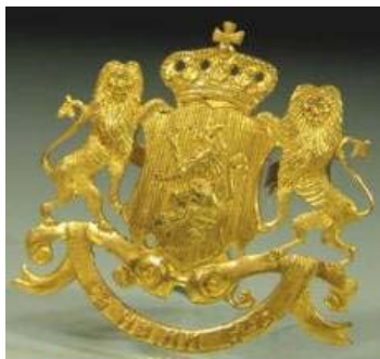
Кокарда „Съ нами богъ“

Друго мнение за осмоконечния кръст е, че той символизира православната вяра. Но бил ли е Батенберг кръстен в православна вяра? По-скоро във въпросния символ трябва да виждаме отразено участието на княз Александър Батенберг във войната на православна Русия за освобождение на православна България.