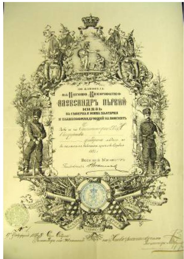
Стоманената матрица за отсичане на втория възпоменателен медал за Сръбско-българската война от 1885 г., съхранявана в Националния Военноисторически музей и патентът за получаване на медала.