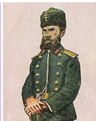
Княз Александър I (ранна снимка), медалът за възшествието му в 1879 г. и офицер от Българското опълчение.

От Русия и големия руски императорски герб е заимстван и девиза „С нами бог“. Освен в латински превод в герба на Александър I, той е изписан на български език на кокарда, също носена от българските военни. На нея е изобразен българският герб с два лъва-щитодържатели. Под герба е девизът „Съ нами богъ“ (виж илюстрацията по-горе).