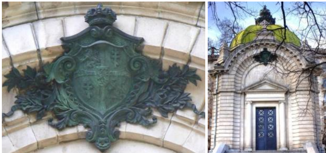
Герб на княз Александър I Батенберг над входа на мавзолея му в София, 1898 г.