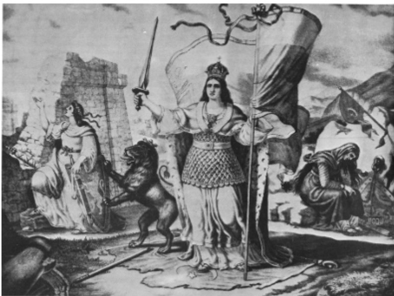
„България, Тракия и Македония, разделени от Берлинския конгрес в 1878 г.“, литография от Николай Павлович, 1881 г.

В първите години след Освобождението художникът Николай Павлович рисува с масло върху платно композицията „България, Тракия и Македония, разделени от Берлинския конгрес в 1878 г.“. Алегоричната картина е наричана още „Разделена България“. През 1881 г. тя е тиражирана като литография. Отпечатана е на 1 юли в Свищовската литография на Д. М. Дробняк. 8