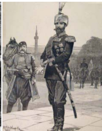
Посрещане на княз Александър I и свитата му в Пловдив на 9 септември 1885 г., гравюри от „The Graphic“ (10.X.1885) и „The Illustrated London News“ (22.IX.1885).

На 6 септември 1885 г. Източнорумелийското правителство е свалено. В Пловдив е провъзгласено съединението на Източна Румелия с Княжество България. Образувано е временно правителство, което поема управлението на областта до пристигането на българския княз Александър I Батенберг, който се обявява на 8 септември във Велико Търново за княз на Северна и Южна България. 1