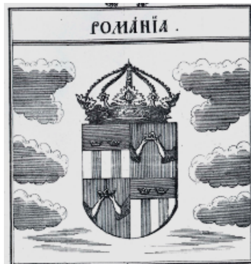
Гербът на Романия от „Стематография” на Христофор Жефарович, Виена, 1741 г.