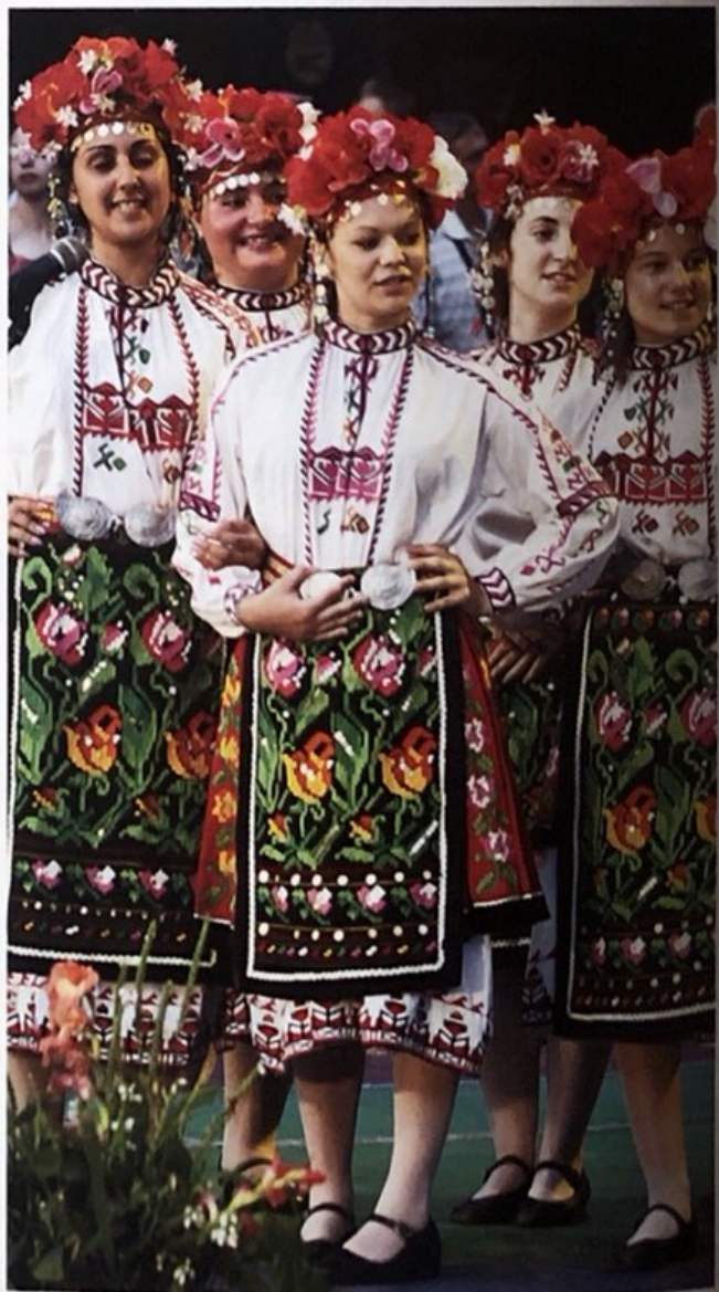
Танцьорки се подготвят за представяне на фолклорен ритуал.