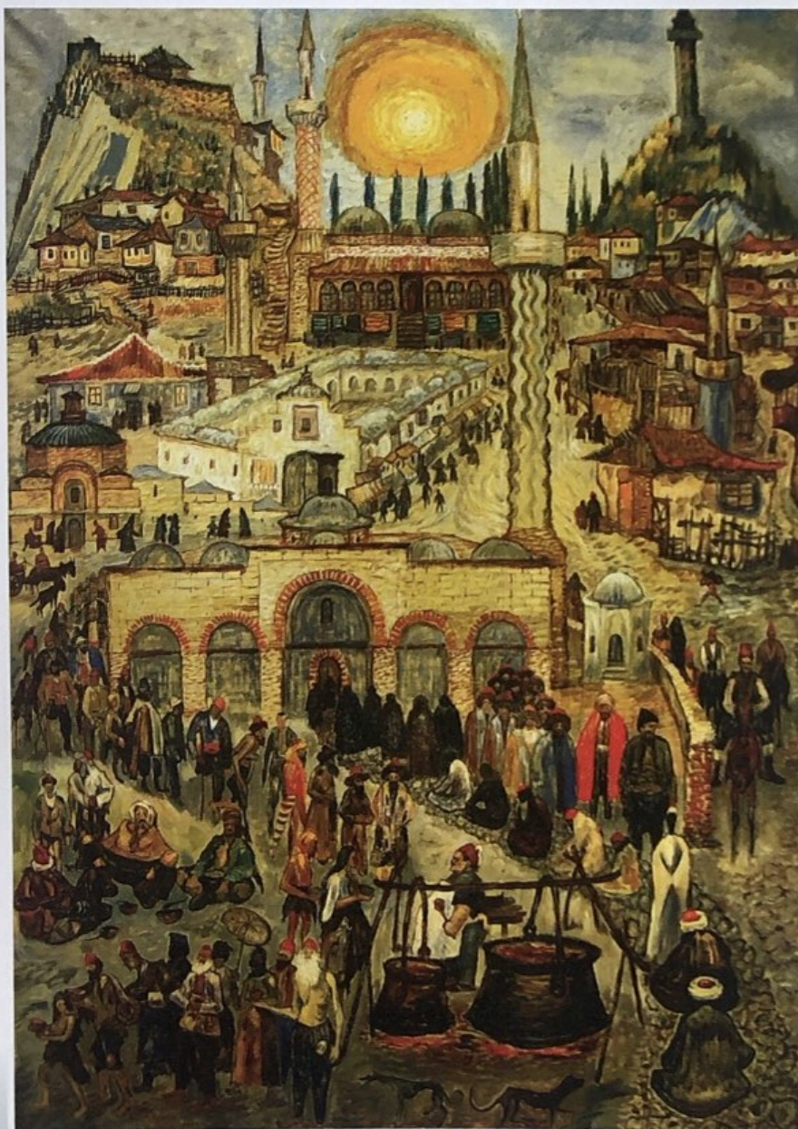
Имарет джамия Картина от Златю Бояджиев. 60-те години на XX век. Градска художествена галерия, Пловдив