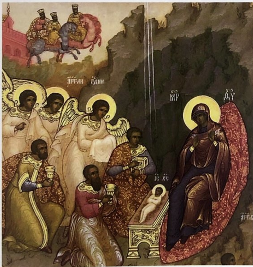
Поклонението на влъхвите Икона от XV век