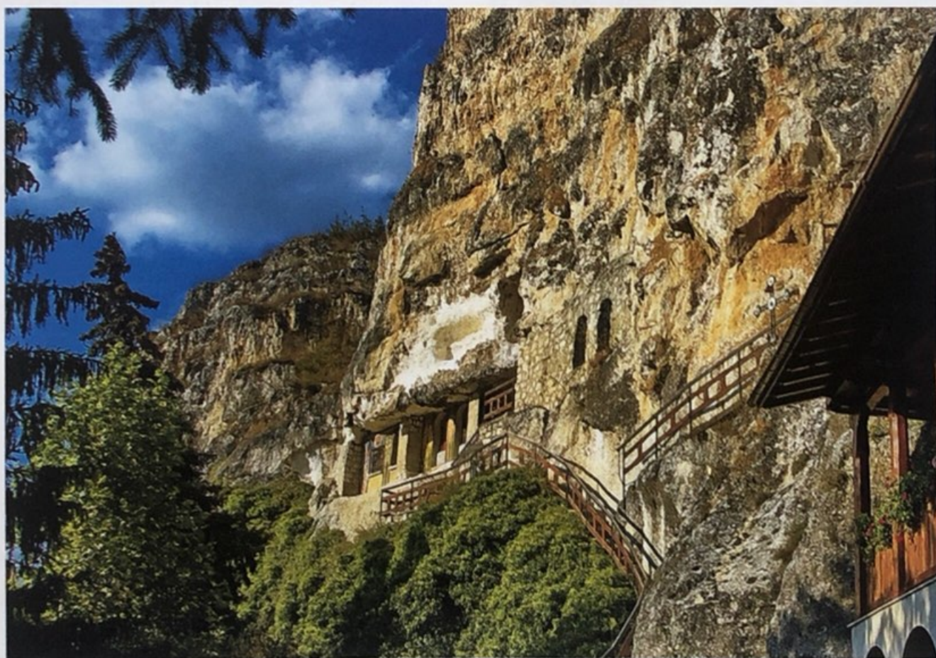
Басарбовският скален манастир „Свети Димитър Басарбовски“

Този манастир е изграден в естествени пещери в скалите край река Русенски Лом по времето на Второто българско царство.