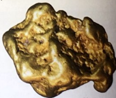
Къс самородно злато