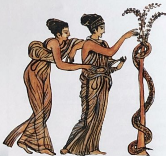
Фрагменти от старогръцка ваза