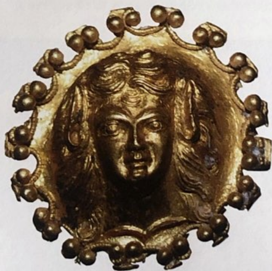
Украшение от златното съкровище в Свещари с релефна женска глава