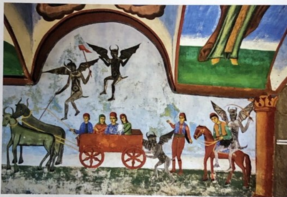
Стенопис от 1866 г. в главната църква на манастира „Свети Георги“ до село Чурилово в планината Огражден, България