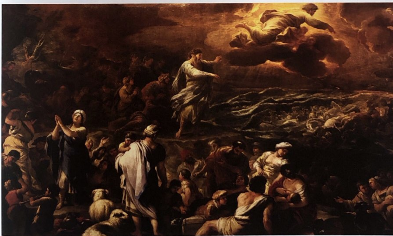
Преминаването през Червено море Картина от италианския художник от XVII век Лука Джордано в църквата „Санта Мария Маджоре“, Италия