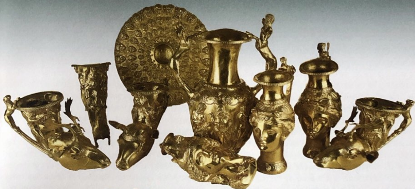
Панагюрското златно съкровище.