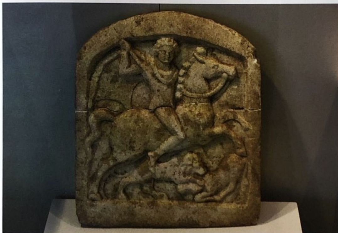
Тракийски конник Барелеф от археологическия музей Мадара