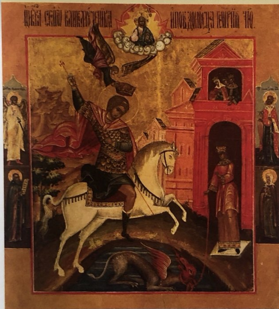
Свети Георги побеждава змея Икона от XVII век