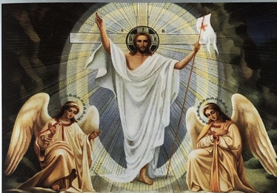
Възкресение Икона от XVI век