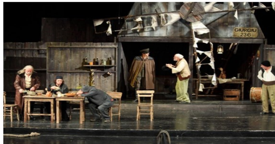
Кръчмата на Странджата в постановка на „Хъшове“ на сцената на Драматичния театър „Сава Огнянов“ – Русе

Така още в I глава се проявяват характерни за Вазовия творчески стил особености: подчиняване на описанията на цялостното послание, вложено в текста, и пряко заявена оценка на повествователя за героите – за тяхната нравственост, за качествата им, за житейския им избор.