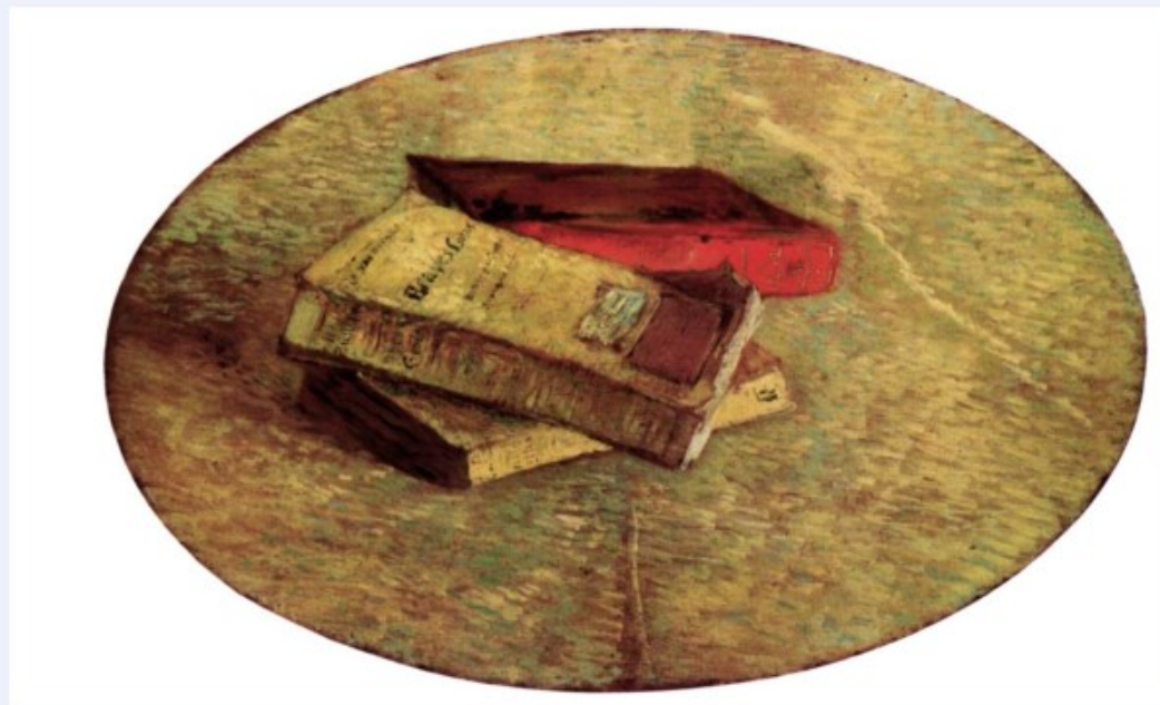
„Натюрморт с три книги“ – картина от световноизвестния нидерландски художник Винсент ван Гог (1853 – 1890), Музей на Ван Гог, Амстердам, Нидерландия

Повестта е прозаическа литературна форма. Тя се различава от разказа по това, че художественото време обхваща по-дълъг период, а пространството е по-обширно и разнообразно. Също така героите обикновено са повече, отколкото в класическия разказ, и са обхванати от по-сложни и разностранни линии на сюжета и на събитията в него.