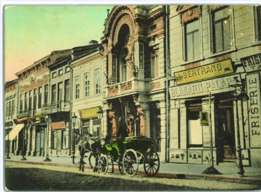
Румънският град Браила през втората половина на 19. век – стара пощенска картичка